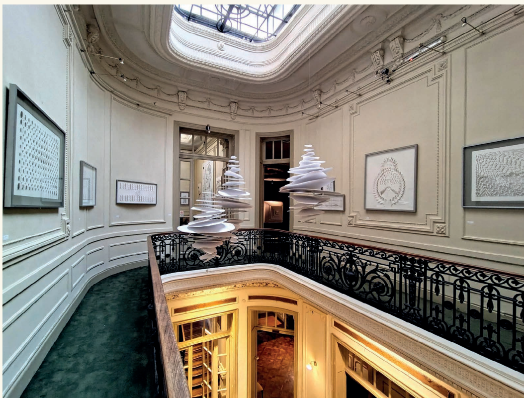
Imagen nº 12. Montaje de la exposición Fragilidad brutal de Valentina Piñero.

ese proceso mántrico que es el recuerdo. La ausencia que representan sus sillas no dista mucho de las figuras blancas que pintaba Milagro Albornoz en sus fotografías.