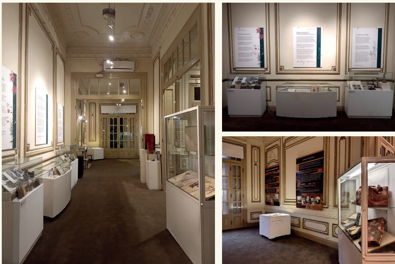
Imágenes nº 7-9. Montaje de la exposición Espigar los campos. Inventarios en el centenario tucumano (19 de junio al 25 de julio de 2025).