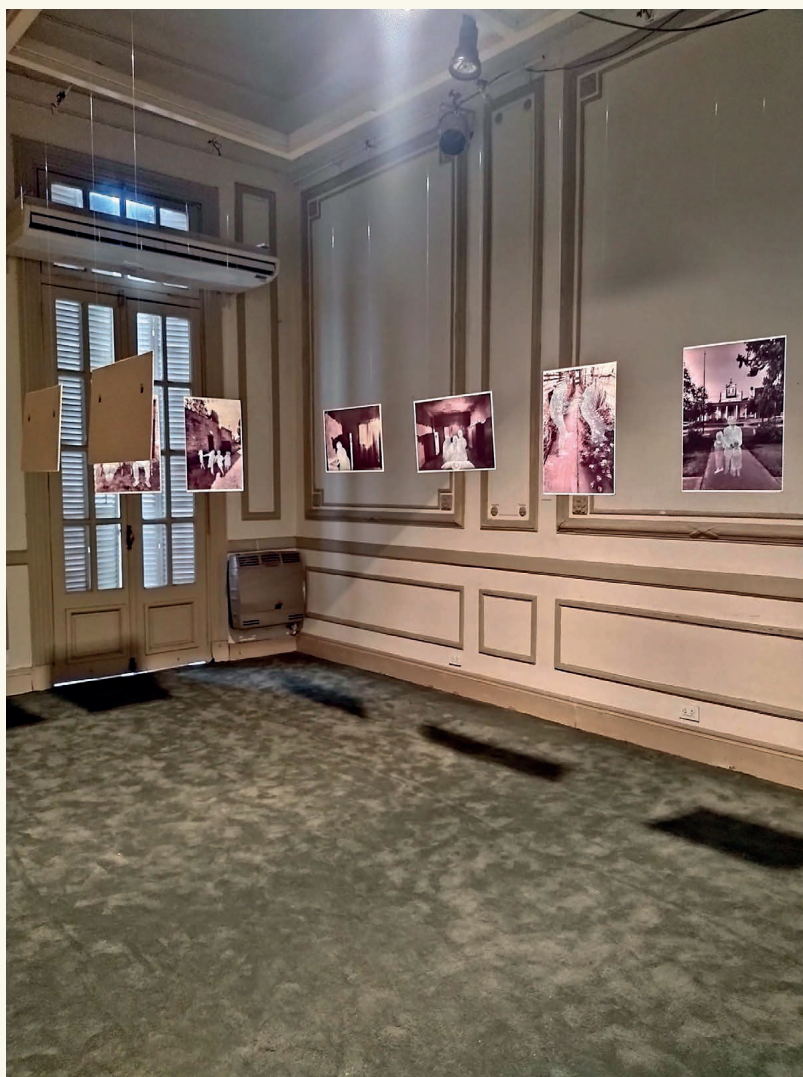
Imagen nº 5 (izquierda). Montaje de la exposición Retratos de una ausencia de Milagro Albornoz.