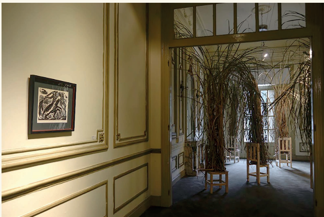
Imagen nº 2 (arriba). Obras de Víctor Rebuffo y Adrián Sosa para la exposición Zarza , curada por Gaspar Núñez.