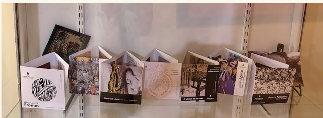
Imagen nº 1. Catálogos de las exposiciones que conformaron la temporada 2025.

Creamos desde el recuerdo, pero también lo hacemos para conjurar el olvido. La sentencia de Fromm expone una relación dialéctica entre memoria y olvido que se resuelve con la transmisión de lo que cada uno recuerda. Es con el acto de contar a otros lo que sabemos del pasado como garantizamos (o al menos aspiramos) que pase de una generación a otra. Es lo que los antropólogos llaman transmisión cultural , porque no basta con recordar si no compartimos esos recuerdos con los otros. Pero ocurre, además, que en todo acto de creación hay un deseo de trascendencia, de permanecer en el recuerdo de los demás cuando ya no estemos. En un intento por evitar que se olvide nuestro paso por el mundo, nos afanamos en dejar alguna huella que quede como testimonio.