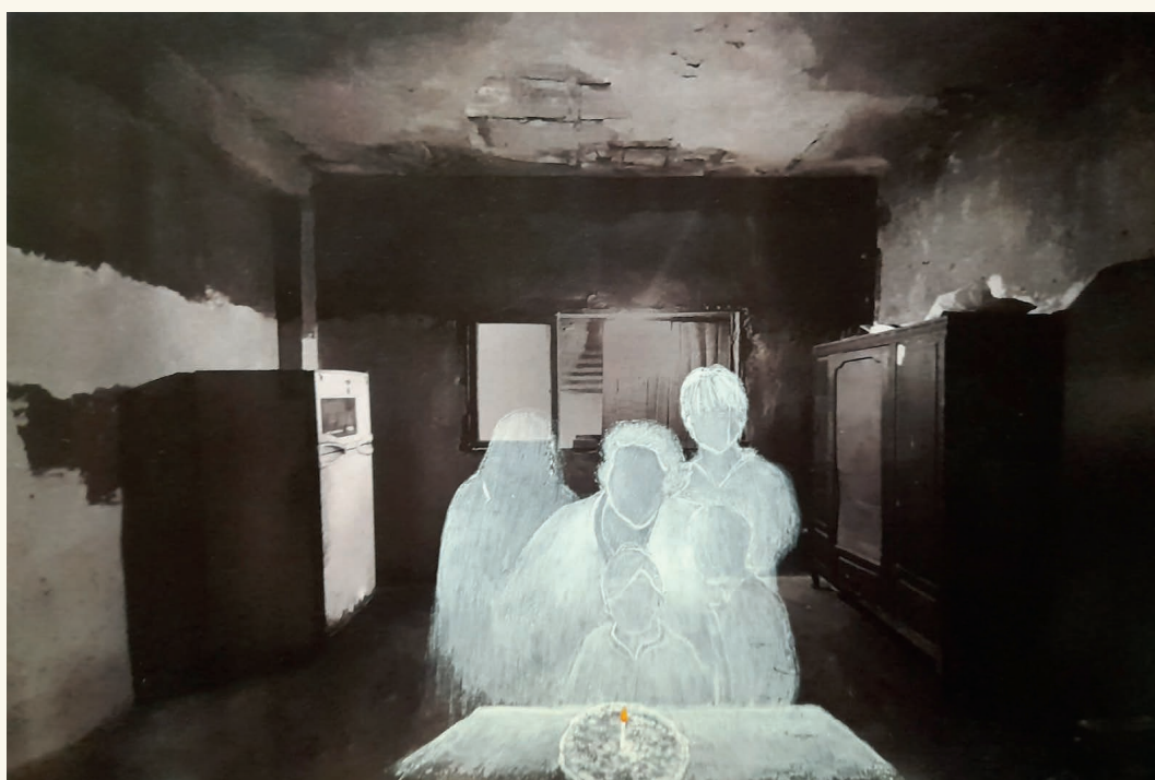
Imagen nº 6 (abajo). Milagro Albornoz, Cumpleaños , 32 x 47 cm, 2023.