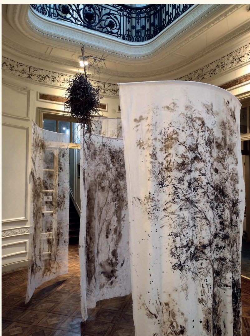
Imagen nº 3 (izquierda). Montaje de la exposición Lo eterno suspendido de Marcela López, con curaduría de Cecilia Quinteros Macció.