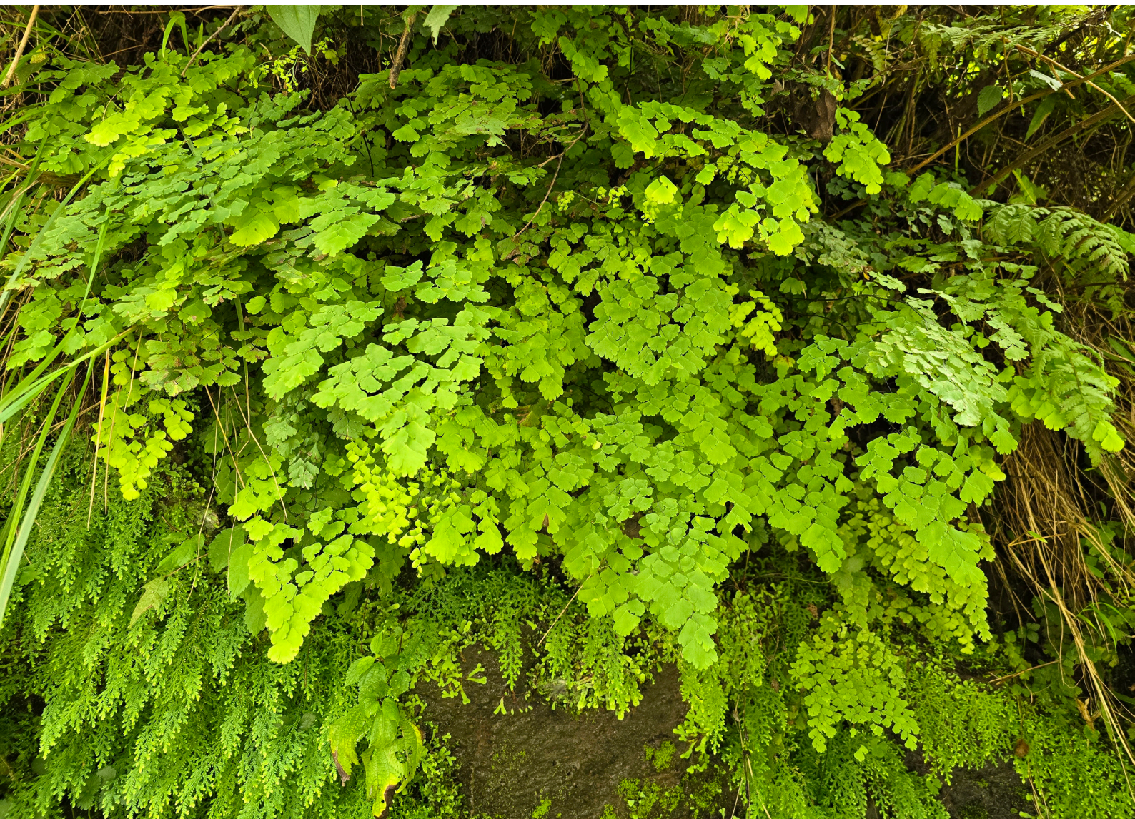
Figura 5. Hábito de crecimiento de Adiantum lorentzii .

En Argentina, Adiantum está representado por alrededor de 17 especies que se distribuyen principalmente en regiones húmedas de casi todo el territorio, aunque su mayor diversidad se encuentra en el norte y centro del país.