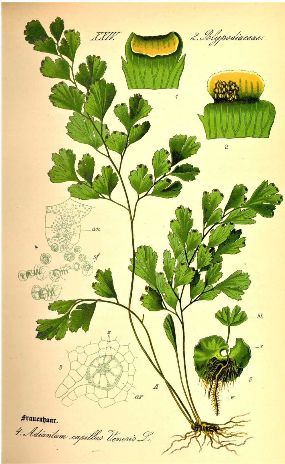
Figura 4. Adiantum capillus-veneris . Otto Wilhelm Thomé "Flora von Deutschland", Österreich und der Schweiz, 1885, Alemania.