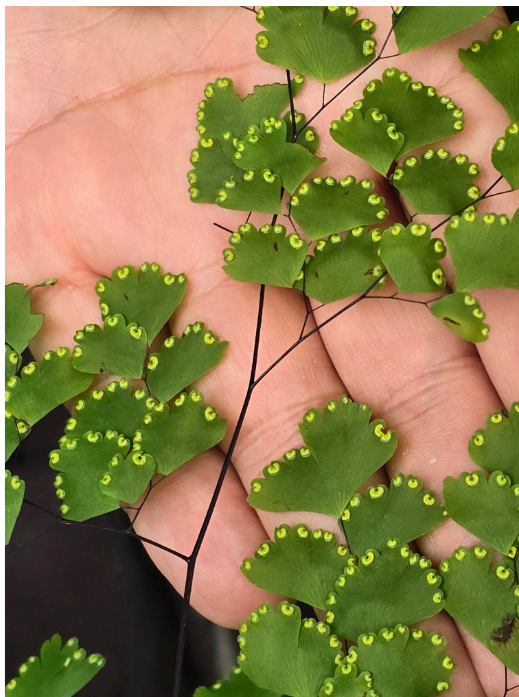
Figura 7. Soros amarillos en el envés de la fronde, característica única de Adiantum lorentzii .