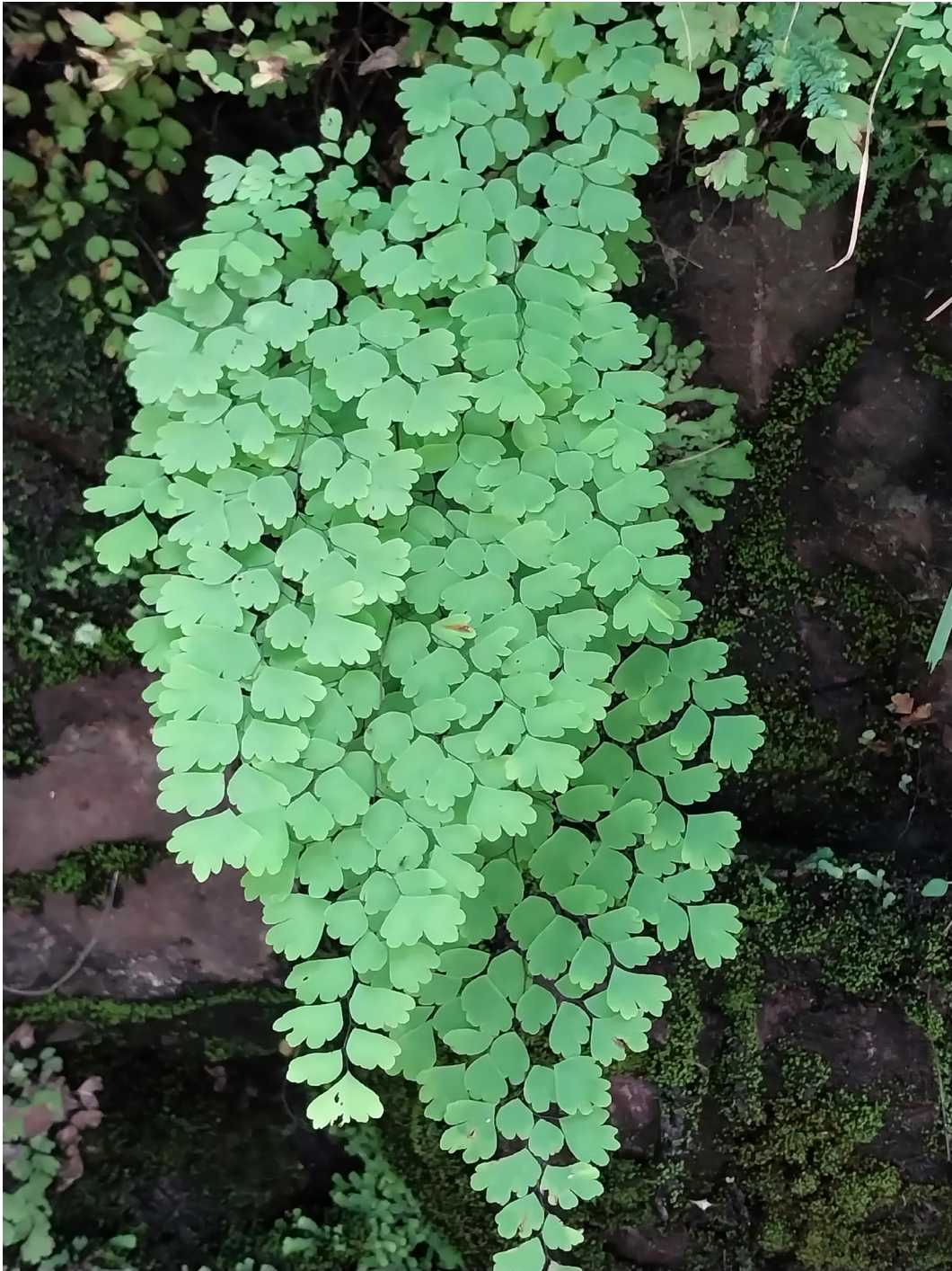
Figura 6. Aspecto de las frondes de Adiantum lorentzii .