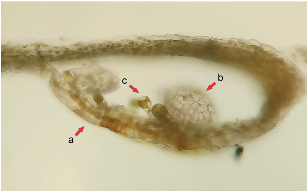
Figura 3. Corte transversal del soro Adiantum lorentzii donde se observa el pseudostrobilo (a), la posición de los esporangios (b) y presencia de tricomas glandulares (c).

Dioscórides, cirujano militar en el ejército romano del emperador Nerón, lo menciona en su obra “De Materia medica” (capítulo 137 del Libro IV): “El adianto, llamado polytrico de algunos, produce unas hojuelas como las del culantro, hendidas por las extremidades, y unos talluelos en extremo subtiles, luengos de un palmo, negros y relucientes, de los cuales penden las hojas”.