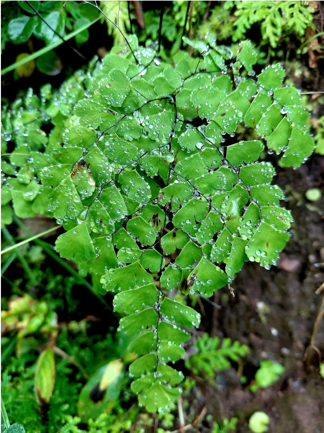
Figura 1. Fronde de Adiantum donde se observa cómo repele el agua.