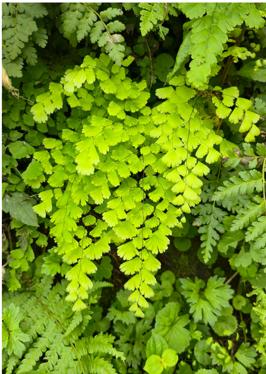
Figura 8. Aspecto de la planta de Adiantum lorentzii .

En Argentina, se ha registrado el uso etnobotánico de las plantas de A. lorentzii como abortivas, para calmar los dolores menstruales y durante el embarazo para facilitar el parto, dolores y enfermedades posparto, mientras que la fronde ha sido utilizada como antitusiva (Barboza et al. , 2009).