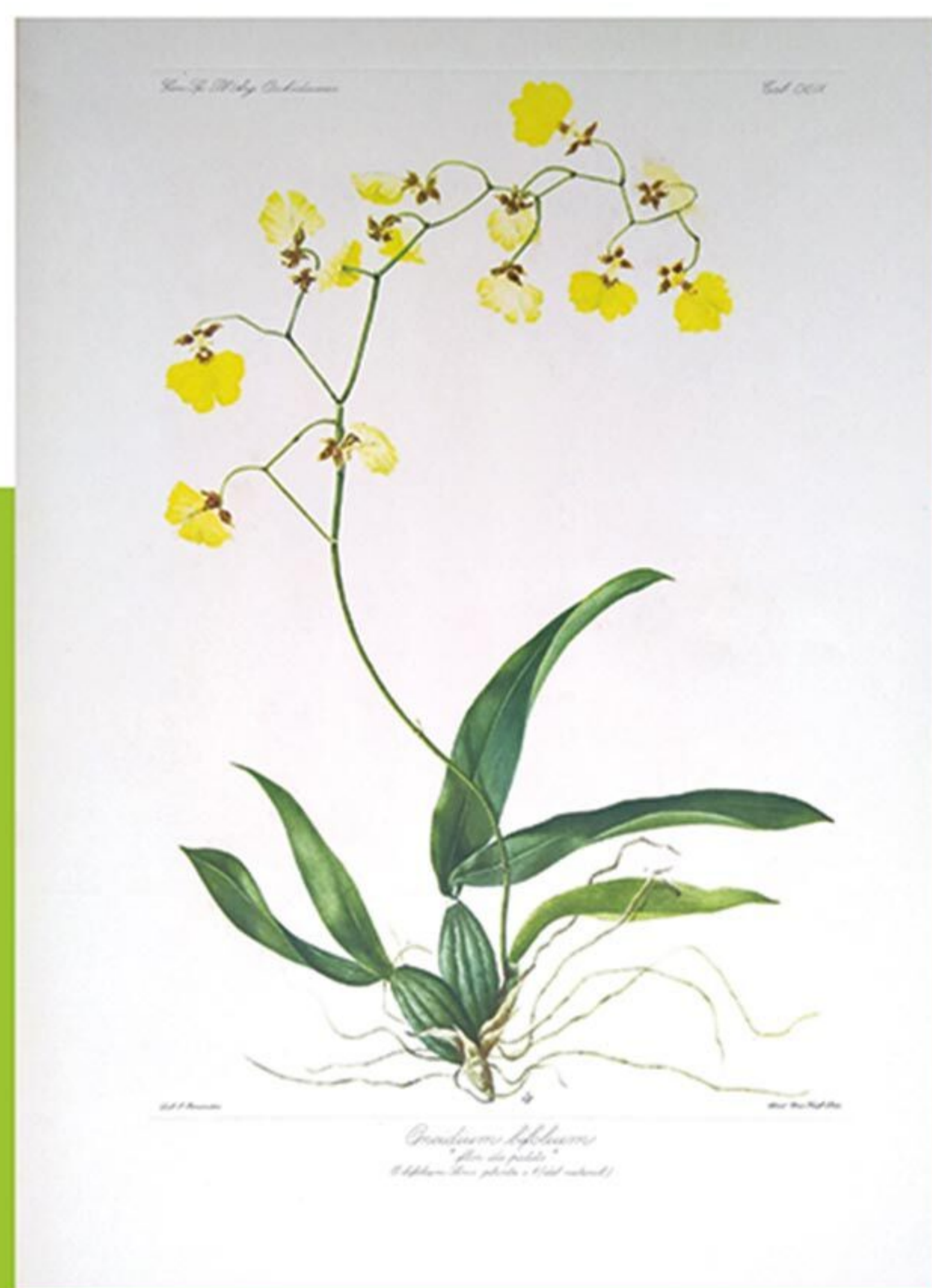
Oncidium bifolium “flor de patito” Genera et Species Plantarum Argentinae (1943).

PROTECCIÓN: se protegen del frío sólo a las especies tropicales. Otras, para florecer, necesitan sentir frío (nunca heladas).