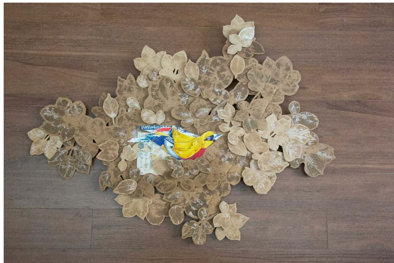
El crujir de las hojas hace canción Cartón calado y pintura acrílica 143 x 107 cm 2025