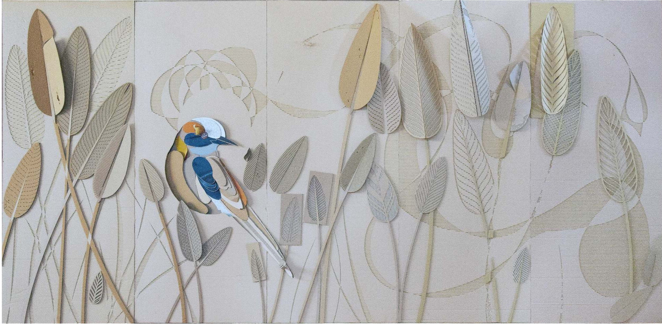
El escondite del florero Cartón calado y pintura acrílica 360 x 176 cm 2026