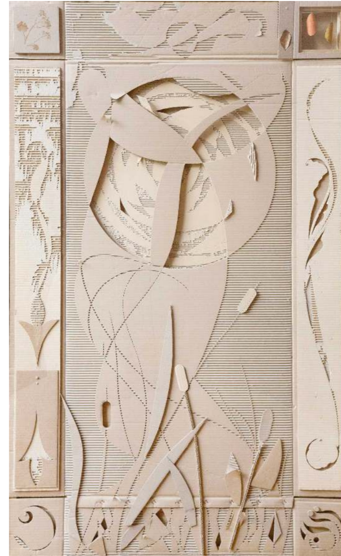
Noche de fertilidad en el pantano Cartón calado 186 x 114 cm 2025