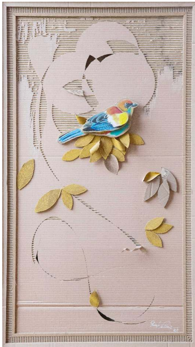
Anuncio de lluvia Cartón calado y pintura acrílica 127 x 72 cm 2026