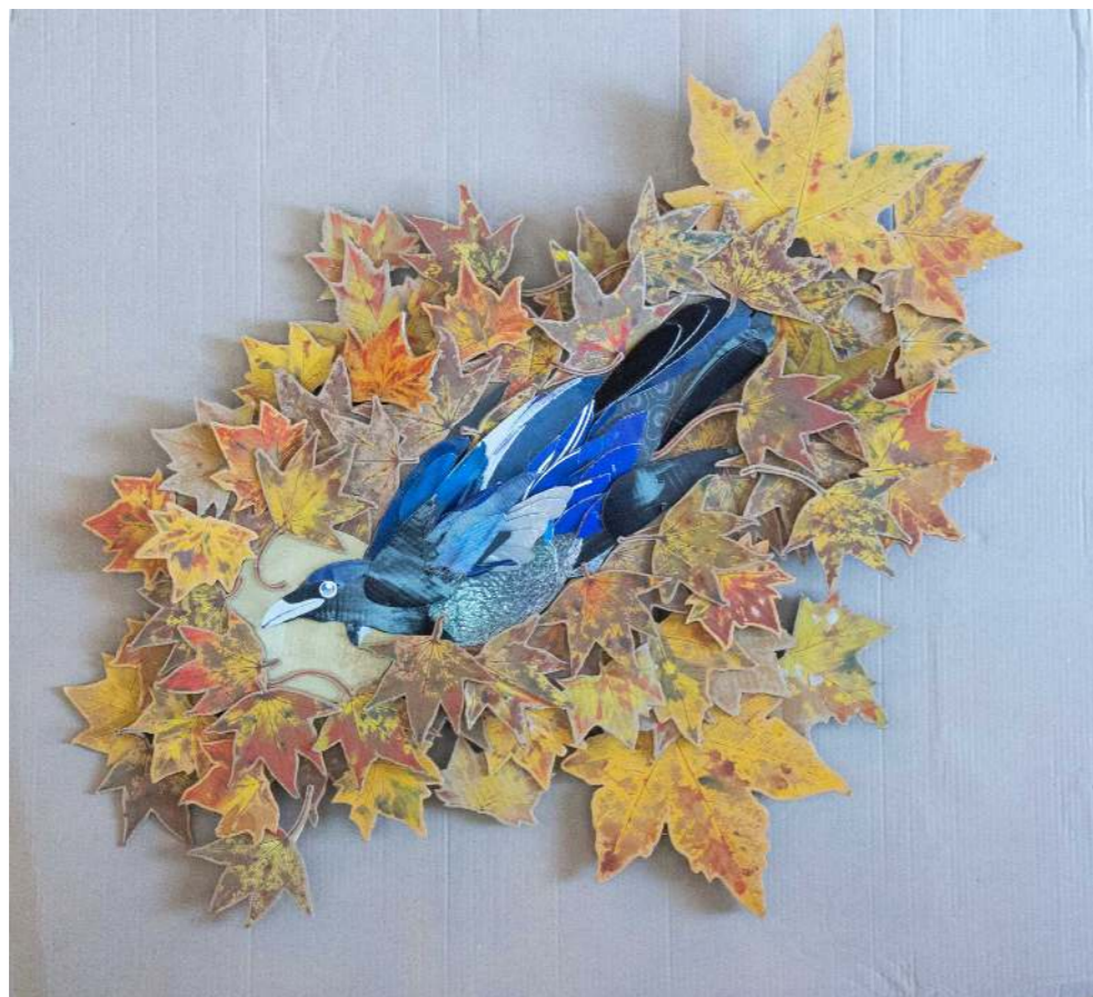
Marcador de territorio Cartón calado y pintura acrílica 110 x 86 cm 2025