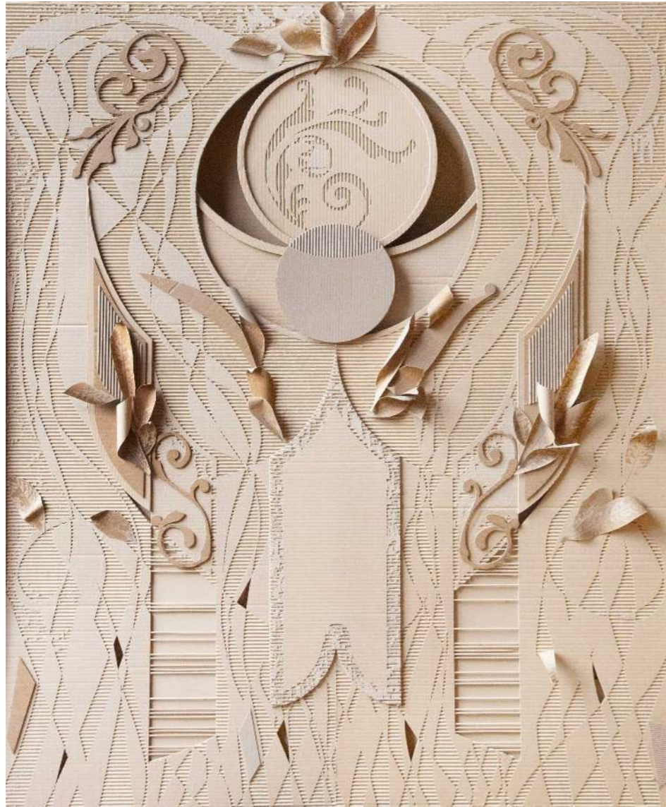
Portal del tiempo Cartón calado 176 x 144 cm 2025