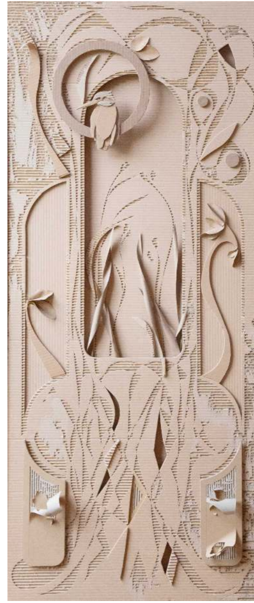
El que mira ventana adentro Cartón calado 172 x 74 cm 2025