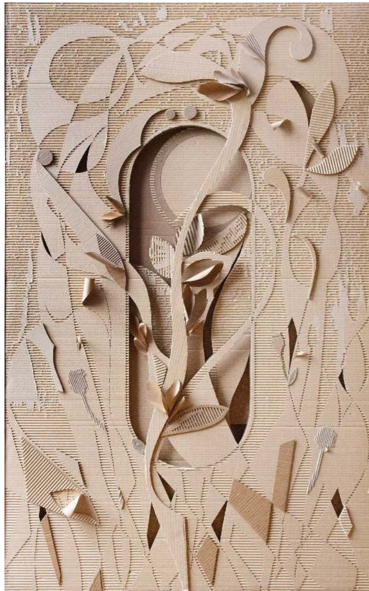
Fuego en la jungla Cartón calado 180 x 112 cm 2025