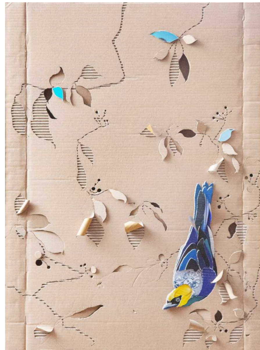
Tú me miras mientras yo te veo Cartón calado y pintura acrílica 101 x 77 cm 2025