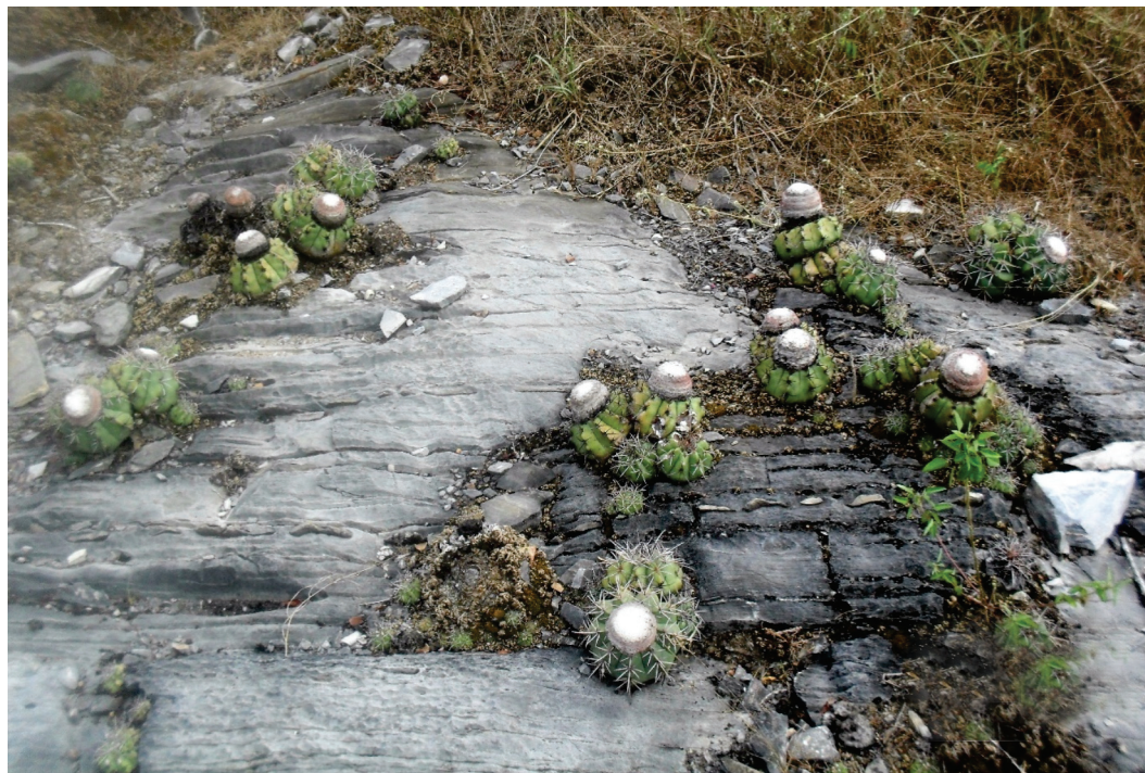
Fig. 1. População de Melocactus sergipensis em seu ambiente natural.

sergipanos, sendo seis pertencem à mesorregião do Alto Sertão (Canindé de São Francisco, Gararu, Monte Alegre, Nossa Senhora da Glória, Poço Redondo e Porto da Folha), nove ao Leste do estado (Aracaju, Pirambu, Estância, Itaporanga D' Ajuda, Japarutuba, Japoatã, Neópolis, Pacatuba e Santo Amaro das Brotas), e seis a região Agreste (Areia Branca, Itabaiana, Macambira, Poço Verde, Simão Dias e Tobias Barreto). Na Fig. 3, espécies do gênero Melocactus que compõem a flora sergipana.