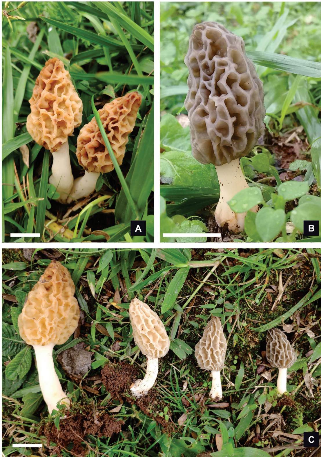
Fig. 2. Morchella esculenta (Gorriti 323). Aspecto general de los ascomas. Escala = A-B: 1 cm; C: 2 cm.